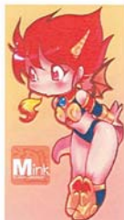
Illustration Diana Jakobson