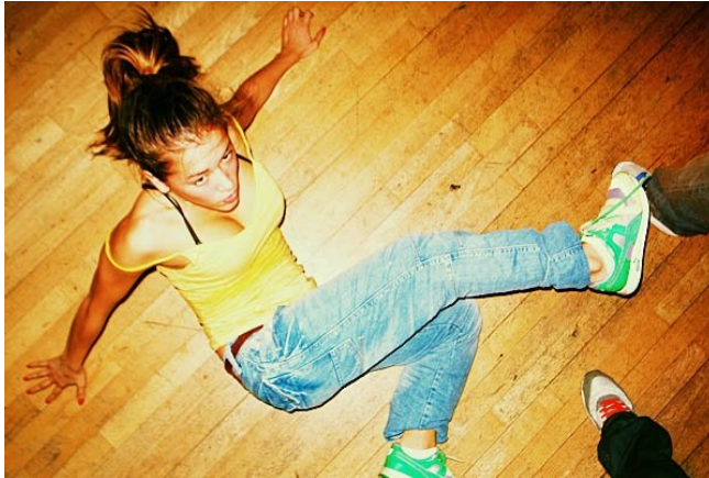
Dansjam i Rinkeby Folkets Hus

Dans jam med klubb soulmates från 16 år. Music inspiration for body expression House music - for your mind, body and SOUL!